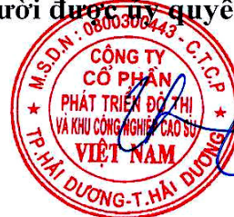
Phạm Ngọc Thảo