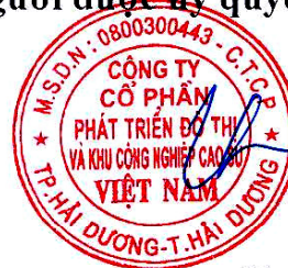
Phạm Ngọc Thảo