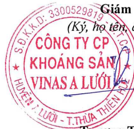
Trương Thế Sơn