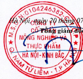
TRẦN NGỌC QUỲNH