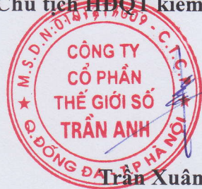
Trần Xuân Kiên