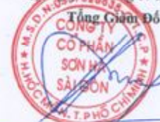
Nghiêm Phú Hùng