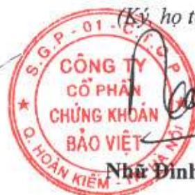
Nhà Đinh Hòa