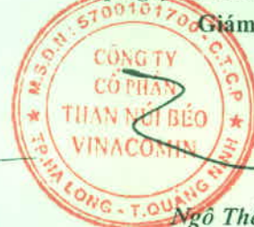
Ngô Thế Phiệt