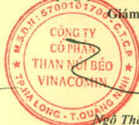
Ngô Thế Phiệt