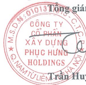
Trần Huy Tường