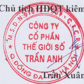
Trần Xuân Kiên