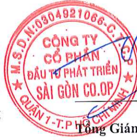
Tổng Giám đốc