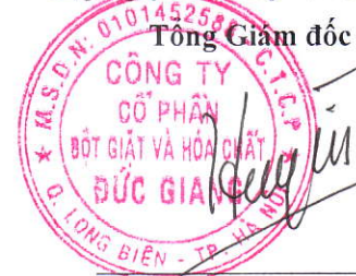
Đào Hữu Huyền