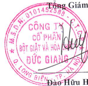
Đào Hữu Huyền