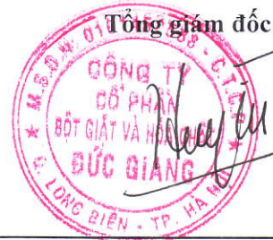
Đào Hữu Huyền