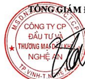
Đường Hùng Cường