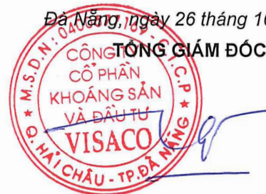
TRƯƠNG THẾ TÙNG