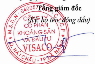
TRƯƠNG THẾ TÙNG