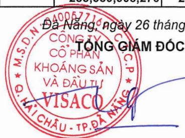
TRƯƠNG THẾ TÙNG