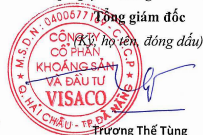
Trương Thế Tùng