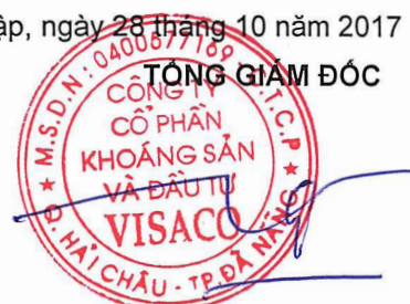
Trương Thế Tùng