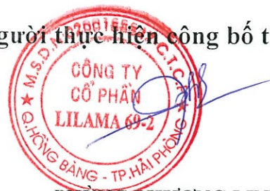
PHÙNG PHƯƠNG LINH