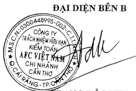
TRANG ĐẮC NHA