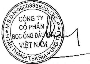
Cao Khánh Hưng

Phiên họp Đại hội đồng cổ đông thường niên năm 2017 của Công ty Cổ phần Bọc ống Dầu khí Việt Nam đã kết thúc vào hồi 11 giờ 55 phút, ngày 09 tháng 03 năm 2017, Biên bản này gồm chín (09) trang, được lập thành 5 bản chính, Chủ tọa Phiên họp và Thư ký cùng liên đới chịu trách nhiệm về tính trung thực, chính xác của nội dung Biên bản này.