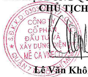
Lê Văn Khôi