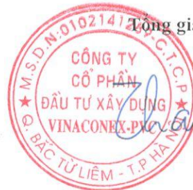
Vũ Thành Kiên