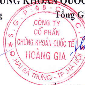
Trần Thị Thu Hương

(Các thuyết minh từ trang 14 đến trang 36 là bộ phận hợp thành của Báo cáo tài chính riêng này)