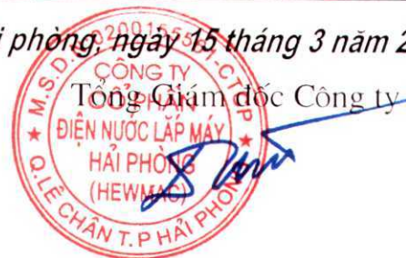
Đỗ Huy Đạt