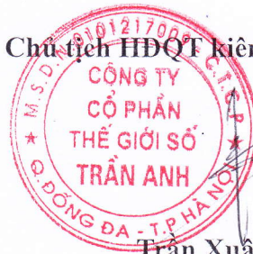
Trần Xuân Kiên