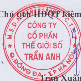
Trần Xuân Kiên