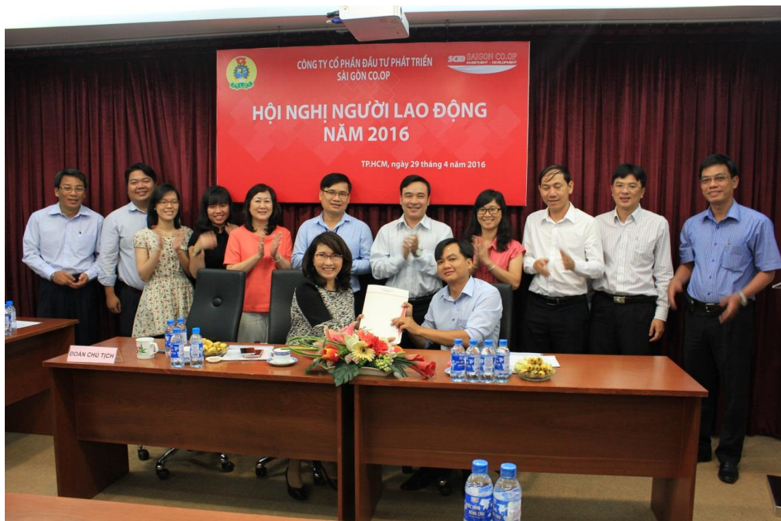
Hội nghị Người lao động