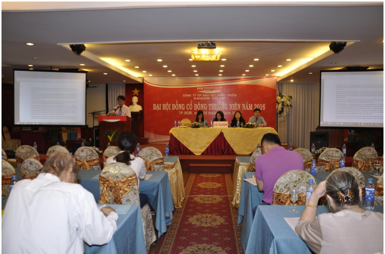
Đại hội đồng cổ đông thường niên năm 2016