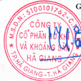
Đỗ Khắc Hùng