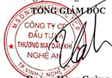
Đương Hùng Cường