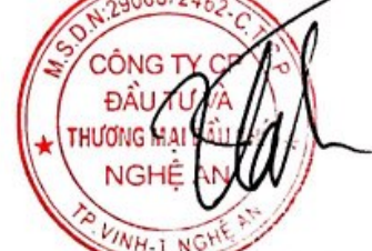
Đường Hùng Cường