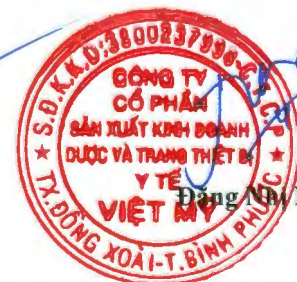
Đặng Như Nương