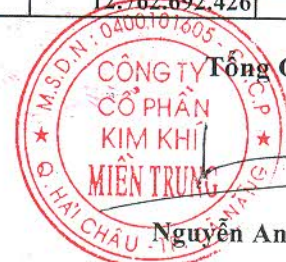
Trần NHN Thành Tuấn