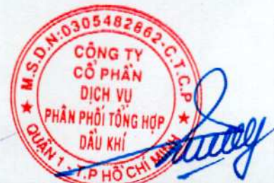
Vũ Tiến Dương Chủ tịch hội đồng quản trị