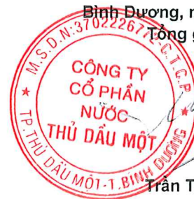
Trần Thế Hưng