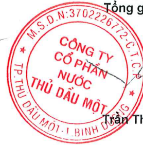
Trần Thế Hưng