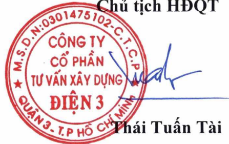
Thái Tuấn Tài

TM. Đại hội đồng cổ đông thường niên năm 2017 Chủ tịch HĐQT