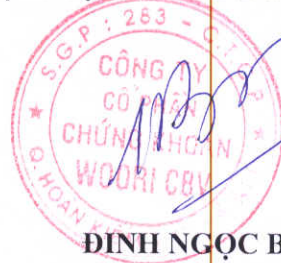
ĐINH NGỌC BẰNG