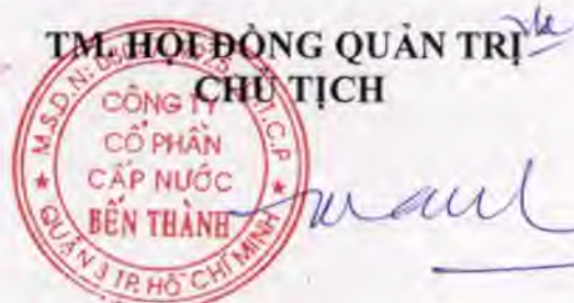
Trần Công Thanh

Thể lệ bầu cử này được đọc công khai trước Đại hội đồng cổ đông và lấy ý kiến biểu quyết của các cổ đông trước khi tiến hành bầu cử. Nếu được Đại hội đồng cổ đông thông qua với tỷ lệ từ 65% trở lên của tổng số phiếu biểu quyết của tất cả cổ đông dự họp sẽ có hiệu lực thi hành bắt buộc đối với tất cả các cổ đông./.