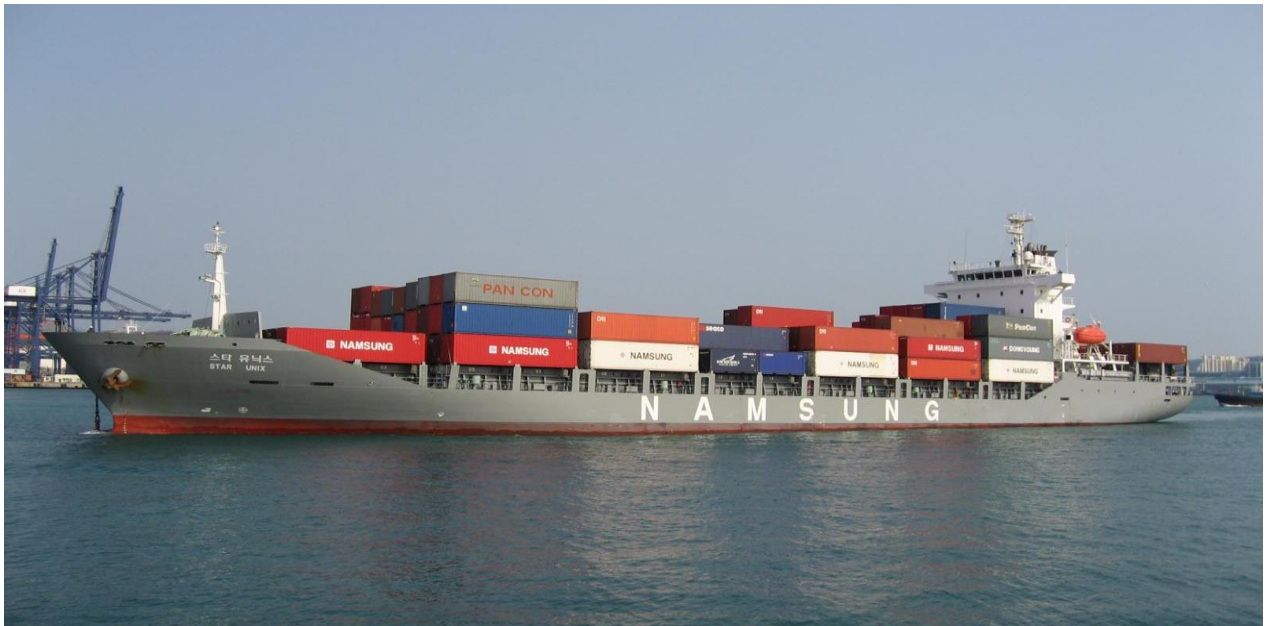
Hình ảnh: Phục vụ tàu container cho hãng tàu Namsung Shipping.