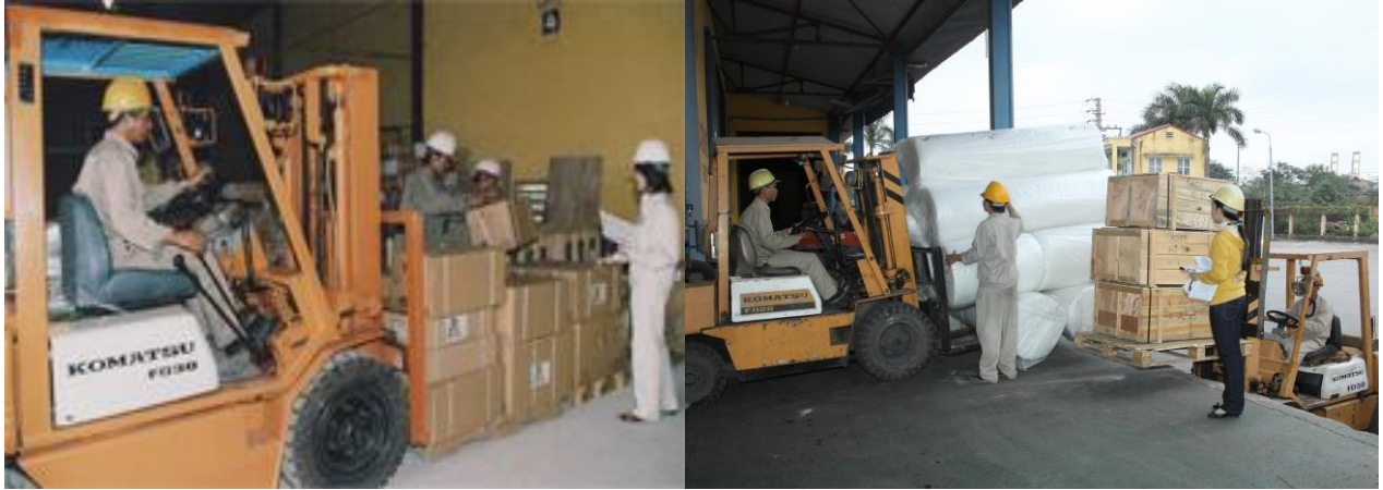
Hình ảnh: Tác nghiệp kiểm đếm hàng hóa tại kho CFS – Northfreight Hải Phòng.