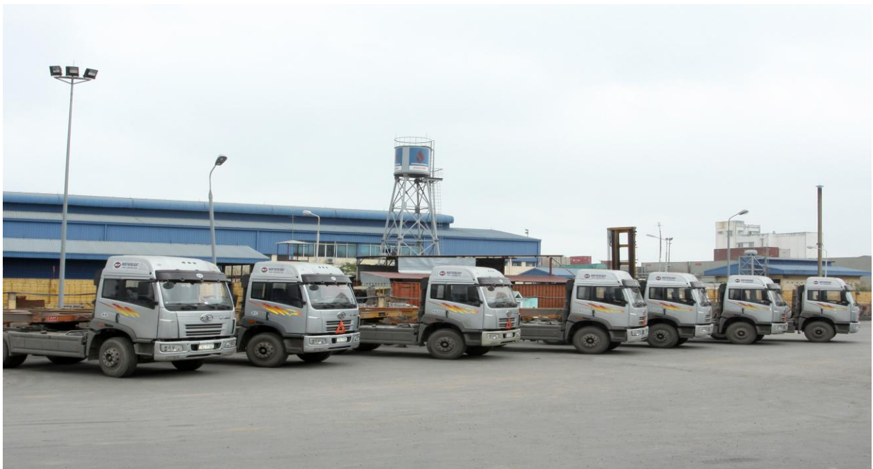
Hình ảnh: Khai thác kho, bãi và đội vận tải NorthFreight tại Hải Phòng.

+ Nhiều khách hàng gặp khó khăn trong kinh doanh nên phải thu hẹp hoặc rời bỏ thị trường. Một số khách hàng lớn của công ty đã tự tổ chức vận tải bằng cách lập ra các công ty vận tải hoặc sử dụng các công ty vệ tinh của mình, chấm dứt dịch vụ với VOSA.