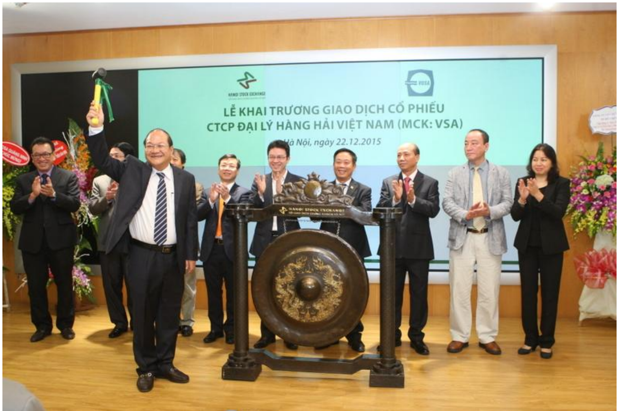
Hình ảnh: Lễ khai trương giao dịch cổ phiếu VSA tại sàn giao dịch HNX ngày 22/12/2015.

+ Ngày 22/12/2015, cổ phiếu Công ty Cổ phần Đại lý Hàng hải Việt Nam đã chính thức được niêm yết trên sàn giao dịch chứng khoán Hà Nội (HNX) với mã niêm yết là VSA và giá chào sàn là 37.000 đồng/cổ phiếu.