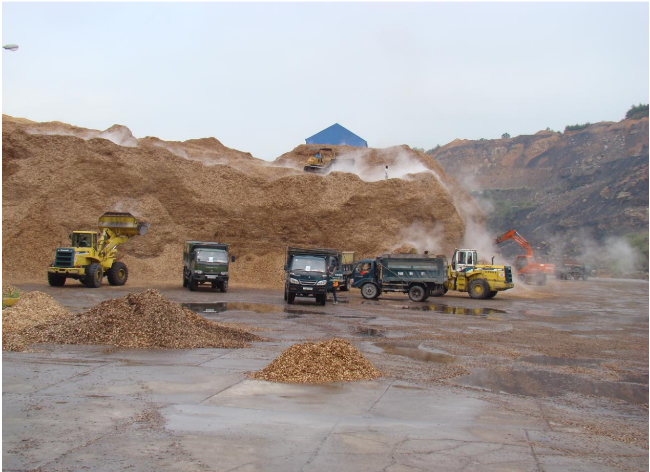
Một số hình ảnh: Khai thác kho, bãi VOSA Quảng Ninh tại Cái Lân.