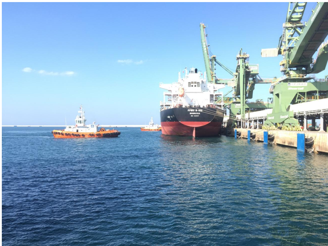
Hình ảnh: Phục vụ tàu hàng rời tại cảng Sơn Dương – Hà Tĩnh