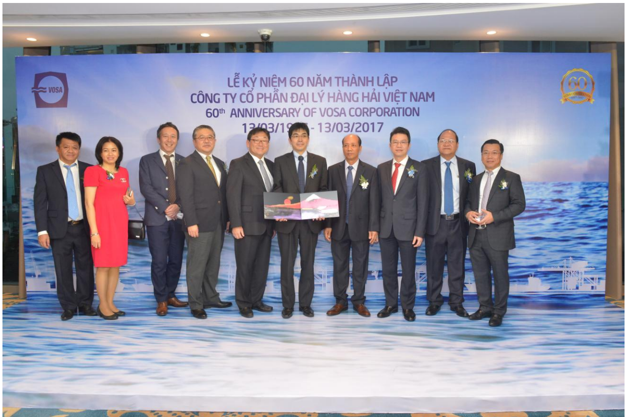
Một số hình ảnh: Lễ kỷ niệm 60 năm thành lập VOSA (13/03/1957 – 13/03/2017).