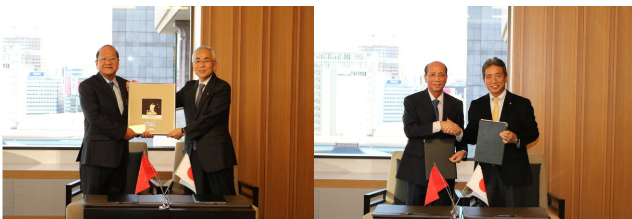
Một số hình ảnh: Lễ ký kết Hợp đồng thành lập Công ty liên doanh NYK Auto Logistics (Việt Nam) ngày 02/12/2016 tại Tokyo (Nhật Bản).