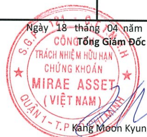
Kang Moon Kyung