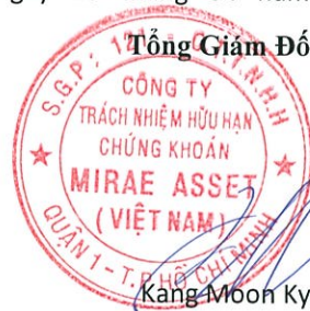
Kang Moon Kyung