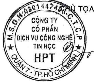
Ngô Vi Đồng