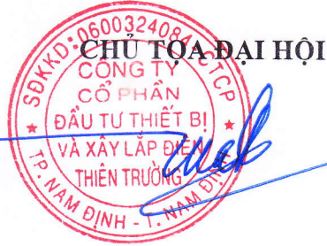
HOÀNG HỮU TUẤN