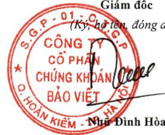
Nhà Đình Hòa