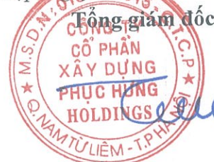
Trần Huy Tường