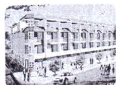
DỰ ÁN KHU DÂN CƯ BÙI MINH TRỰC III