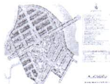
KHU DÂN CƯ 28 HA NHƠN ĐỨC – NHÀ BÈ