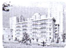
DỰ ÁN KHU DÂN CƯ BÙI MINH TRỰC II