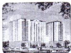
DỰ ÁN KHU B CHUNG CƯ BÙI MINH TRỰC III