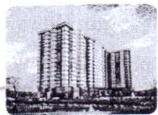
DỰ ÁN CHUNG CƯ 99 BÊN BÌNH ĐÔNG (CAO ỐC BÌNH ĐÔNG CHỢ LỚN)