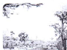
DỰ ÁN LIÊN DOANH KHÁC