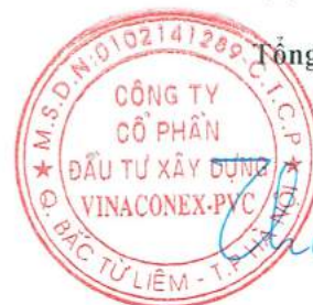
Vũ Thành Kiên