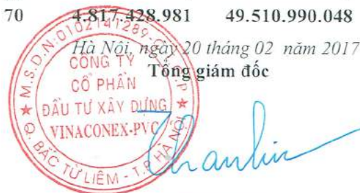
Vũ Thành Kiên