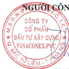
Vũ Thành Kiên