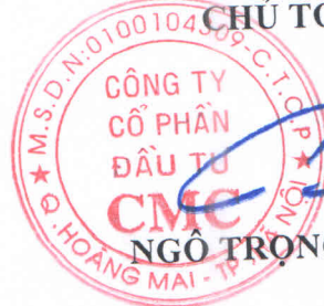
NGÔ TRỌNG VINH