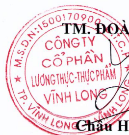
Châu Hiếu Dũng