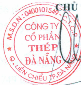
ĐINH XUÂN ĐỨC