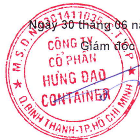
Dương Công Phùng