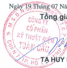
TẠ HUY PHONG