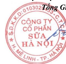
HÀ QUANG TUẤN