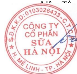
HÀ QUANG TUẤN