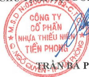
TRẦN BÁ PHÚC